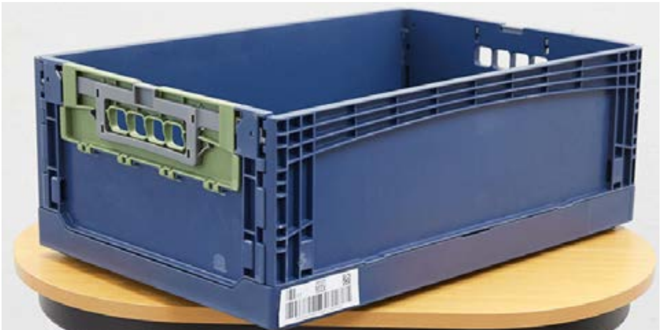
Abbildung 2: Smartbox von GS1 Germany