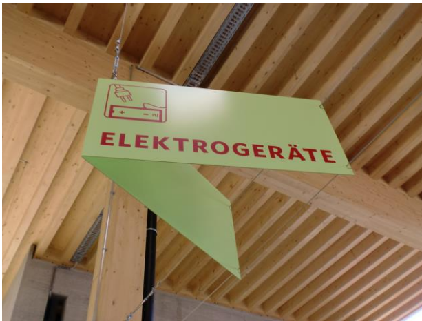
Abbildung 1: Sammelstelle Küssnacht SZ, Beschriftung mit starker Fernwirkung.

Damit eine Beschriftung erfolgreich ist, sind vier Kriterien zu erfüllen, welche in den nachfolgenden Abschnitten erläutert werden.