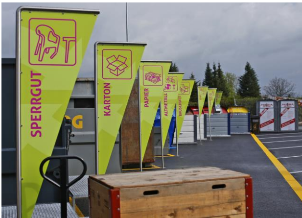
Abbildung 3: Sammelstelle Sins

Das Beschriftungssystem von Swiss Recycling wurde nach den oben genannten Kriterien modular aufgebaut. Mit der empfohlenen Signaletik lehnt Swiss Recycling sowohl an die traditionelle Orientierungsfunktion als auch an die moderne Interpretation an. Der Wimpel, eine kleine Fahne in dreieckiger Form als Grundelement, ist Orientierungspunkt und Identifikationsträger in einem. Er identifiziert die Sammelstelle als solche und orientiert über die verschiedenen Fraktionen innerhalb des Areals. Die Wimpel unterscheiden sich in der Grösse und orientieren durch das Piktogramm mit Beschrieb. In der Proportion sind sie einheitlich. Ihre Beschaffung ist der Anwendung angepasst: Fahnenstoffe für die Fernwirkung, bedrucktes Aluminium für die Fraktionen und Haltestangen aus rostfreiem Chromnickelstahl. Das e-Paper Swiss Recycling Beschriftungssystem ist zu finden unter: