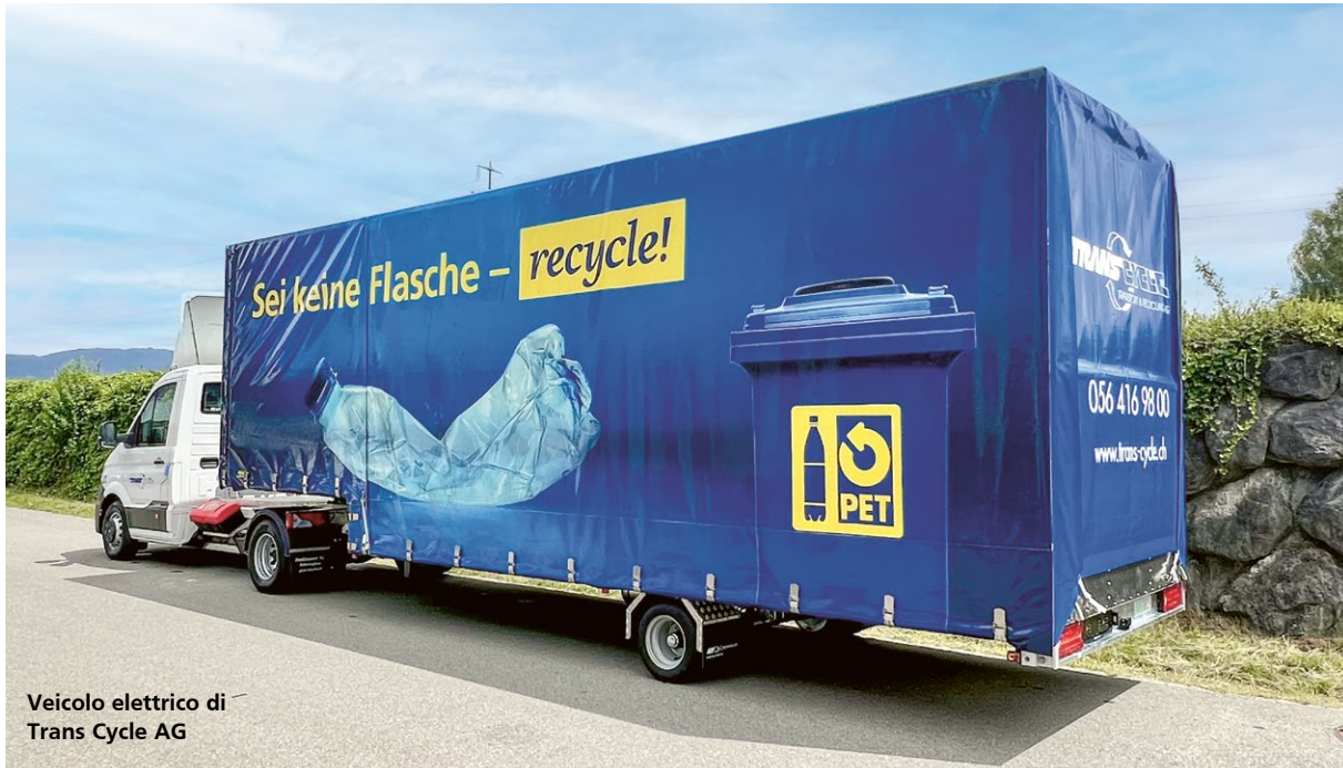
Veicolo elettrico di Trans Cycle AG

l'associazione ha organizzato un convegno per informare e sensibilizzare i partner su questa tematica. Nell'assegnazione degli incarichi, la sostenibilità avrà lo stesso peso del prezzo. I partner hanno accolto positivamente questo impegno e, laddove possibile, hanno già iniziato a sostituire con alternative sostenibili i primi relativi veicoli.